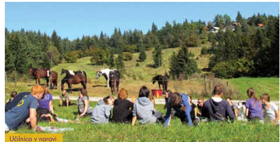
Učilnica v naravi

Dosegamo pozitivne vplive neformalnega druženja dijakov in profesorjev; ustvarijo se posebni odnosi, ki se ohranijo vsa leta šolanja. Dijaki imajo v šoli drugačen odnos tako do sošolcev kot do učiteljev.