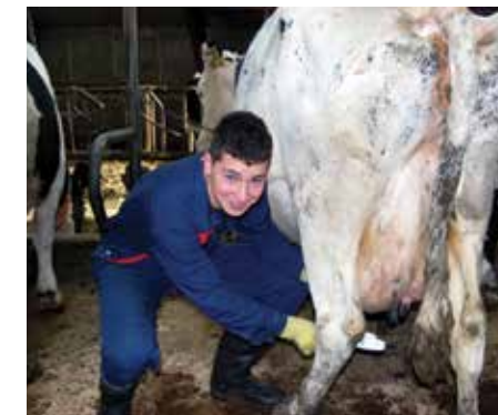
Gimnazija in veterinarska šola