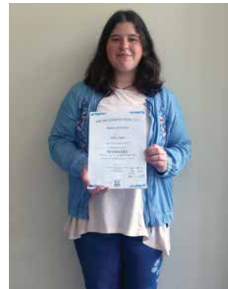
Naša dijakinja je zmagala na mednarodnem tekmovanju Arctic competition 2019 in skupaj z mentorico odpotovala na mednarodno polarno odpravo na sever Norveške.

Dijaki športniki zastopajo šolo na športnih tekmovanjih. Udeležujejo se tekmovanj v košarki, odbojki, atletiki, streljanju, plesu, orientacijskem teku in drugih športih.