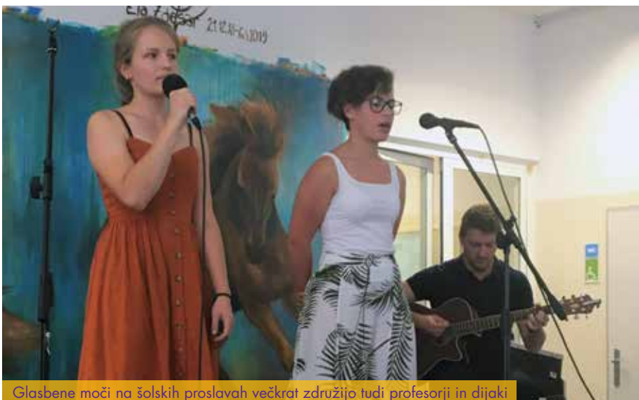
Glasbene moči na šolskih proslavah večkrat združijo tudi profesorji in dijaki

Dijaška skupnost Gimnazije in veterinarske šole (DS GVŠ) je skupnost vseh oddelkov na šoli. Njena osnovna funkcija je zastopati interese dijakov GVŠ. Na sestankih, ki potekajo enkrat mesečno, se dijaki pogovarjajo o dejavnostih na šoli in zunaj nje, izpostavljajo aktualne probleme na šoli, pripravljajo pa tudi raznorazne projekte, kot so natečaji ipd. Skupnost vsako leto organizira novoletno in pustno prireditev in tako popestri dogajanje na šoli. Šolska dijaška skupnost se vključuje tudi v DSL (Dijaška skupnost Ljubljana) in DOS (Dijaška organizacija Slovenije).