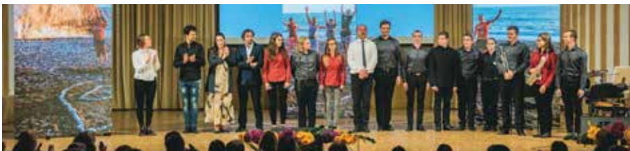
Nastopajoči nekdanji in sedanji dijaki na slavnostni akademiji ob sedemdesetletnici BIC Ljubljana

Gimnazija in veterinarska šola domuje v enem najbolj prijetnih območij Ljubljane, v Mestnem logu, ob Veterinarskih klinikah. Ne obkrožajo je prometne ceste, ne moti nas hrup z ulice; obdaja jo zelenje, ob njej so pašniki, na katerih se pasejo ovce in konji. Senco ji dajejo stara drevesa in tudi tradicija šole sega daleč v preteklost.