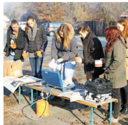
Priprava lojenih pogač za zunanje ptice