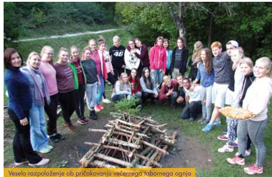
Veselo razpoloženje ob pričakovanju večernega tabornega ognja

Poleg navedenega nudijo razredni tabori izredne možnosti medpredmetnega povezovanja, zato razredne vikende izkoristimo tudi za to. Vedno je eden od vključenih predmetov naravoslovni, saj tabor omogoča terensko delo. Na taboru največkrat izvajamo tudi športne dejavnosti: pohode, tek, balinanje, badminton, veslanje, pohodništvo.