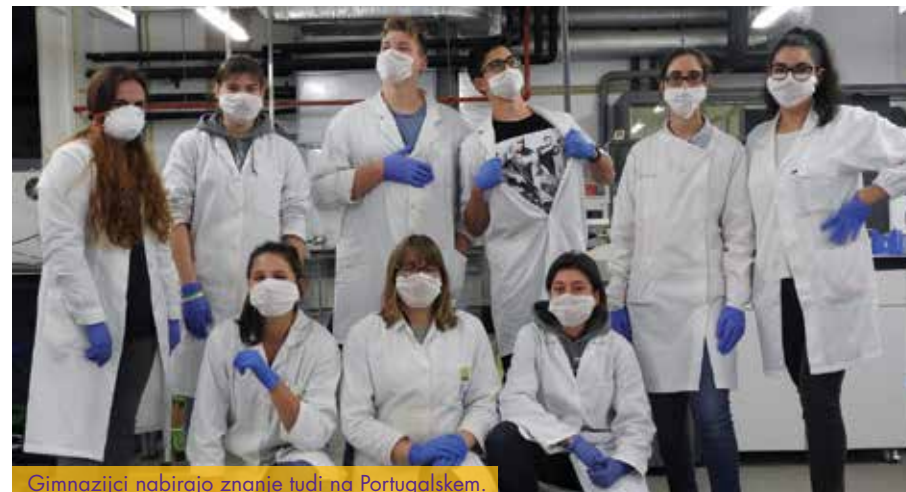
Gimnazijci nabirajo znanje tudi na Portugalskem.

Skupaj s profesorji se udeležujejo tudi mednarodnih konferenc in izobraževani na temo biotehnoške znanosti.