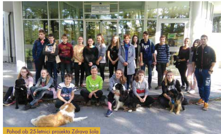
Pohod ob 25-letnici projekta Zdrava šola