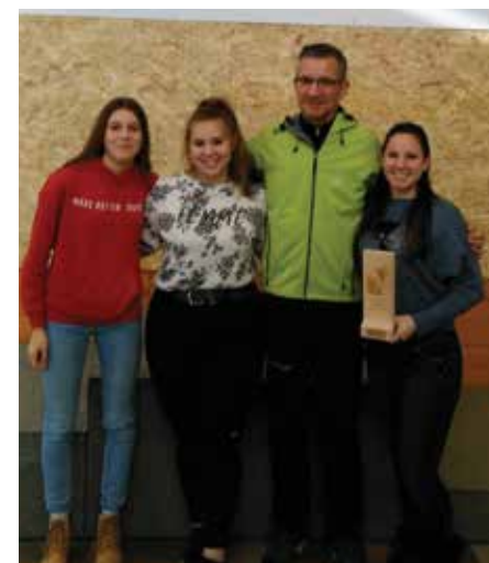
Uspešne dijakinje na strelskem tekmovanju