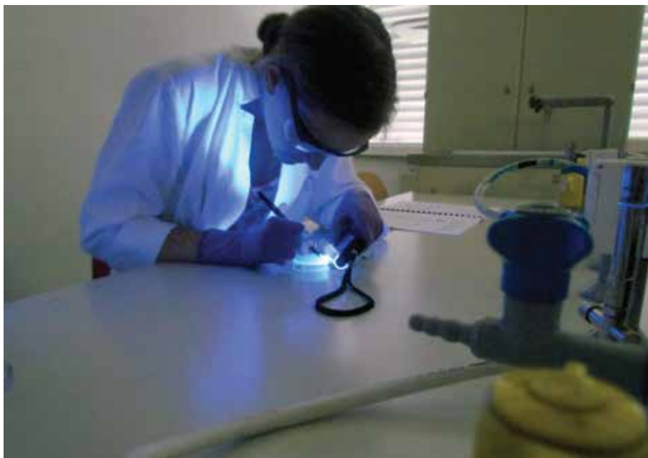
Biotehniški izobraževalni center Ljubljana