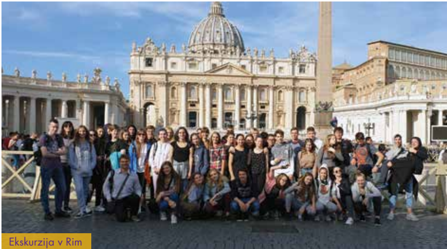
Ekskurzija v Rim

Pomemben del pouka predstavljajo eno- in večdnevne ekskurzije (Italija, Madžarska, Poljska, Francija, Belgija ...), ki jih organizirajo profesorji strokovnih modulov, slovenščine in zgodovine. Tako dijaki spoznajo dobršen del naše domovine, potujemo pa tudi v tujino. Cilj ekskurzij je poleg poglobljanja strokovnih znanj tudi druženje z medsebojnim spoznavanjem, zato so pri dijakih zelo priljubljene.