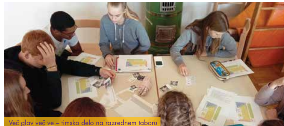
Več glav več ve – timsko delo na razrednem taboru

Razredni tabor je dobesedno »učilnica brez katedra« oz. gre za odprto učno okolje.