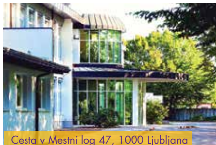
Cesta v Mestni log 47, 1000 Ljubljana