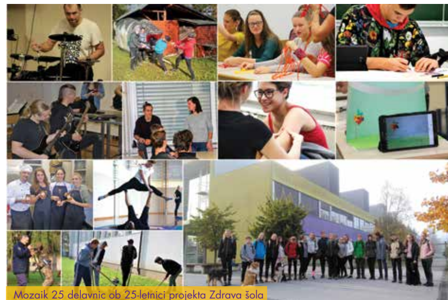
Mozaik 25 delavnic ob 25-letnici projekta Zdrava šola

V naravovarstvenih projektih se dijaki udeležujejo različnih posvetov in dejavnosti v zvezi z mokrišči, s preučevanjem ptic, problematiko onesnaževanja voda in okolja.