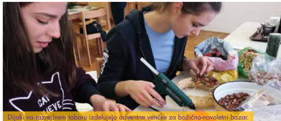
Dijaki na razrednem taboru izdelujejo adventne venčke za božično-novoletni bazar.

Od leta 2005 se predstavljamo pod imenom Biotehniški izobraževalni center Ljubljana s štirimi organizacijskimi enotami: Gimnazija in veterinarska šola, Živilska šola, Višja strokovna šola ter Medpodjetniški izobraževalni center. Enote delujejo na več lokacijah, in sicer v Mestnem logu, na Ižanski cesti in v Šentvidu pri Ljubljani. V Mestni log, kjer domuje tudi Gimnazija in veterinarska šola, se vpisujejo učenci iz vse Slovenije, zato na naših hodnikih in v učilnicah slišimo vse narečne govorce.