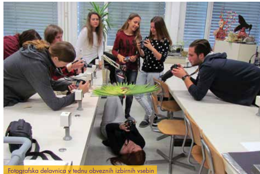
Fotografska delavnica v tednu obveznih izbirnih vsebin

Obvezne izbirne vsebine in interesne dejavnosti se delijo na obvezni del in prosto izbiro.