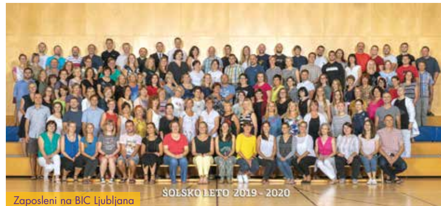
Zaposleni na BIC Ljubljana