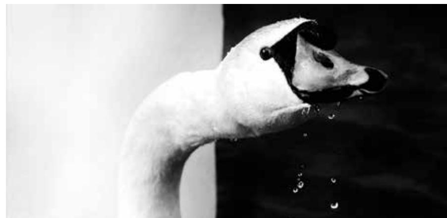
Dijakinja Ela Zdešar je za svojo fotografijo Labodji kontrast prejela diplomu na Slovenski pregledni razstavi mladinske fotografije MLADI 2019.