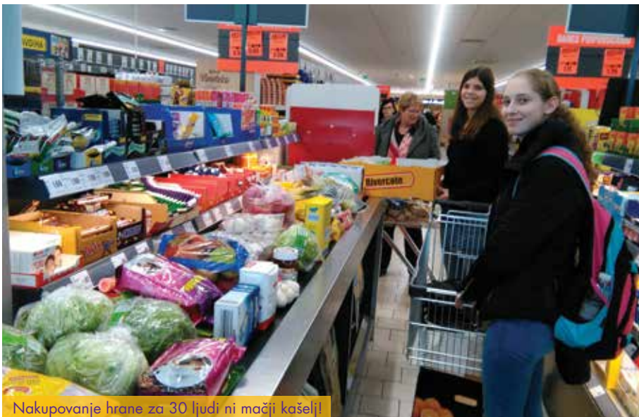
Nakupovanje hrane za 30 ljudi ni mačji kašelj!

Bivanje in gibanje v naravi: že samo bivanje zunaj naselja, na samem, v lovski koči z obsežnim zunanjim prostorom s klopmi, »jurčkom« (z lesom obit prostor, v katerem je večje odprto kurišče, kjer se lahko družimo zvečer ob vsakem vremenu), obdani z gozdom, je pravo doživetje. Ne glede na glavni del programa se z dijaki obvezno odpravimo na pohod v okolico in tudi sicer večino časa prebijemo zunaj.