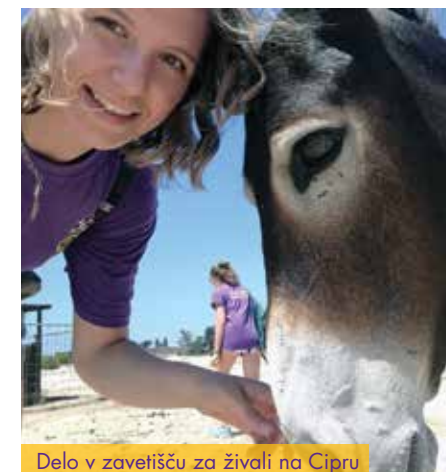
Delo v zavetišču za živali na Cipru