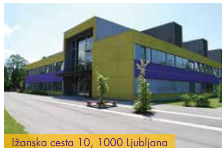
Ižanska cesta 10, 1000 Ljubljana