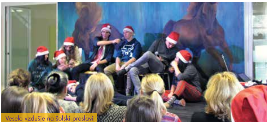
Veselo vzdušje na šolski proslavi

Dijaška skupnost Gimnazije in veterinarske šole (DS GVŠ) je skupnost vseh oddelkov na šoli. Njena osnovna funkcija je zastopati interese dijakov GVŠ. Na sestankih, ki potekajo enkrat mesečno, se dijaki pogovarjajo o dejavnostih na šoli in zunaj nje, izpostavljajo aktualne probleme na šoli, pripravljajo pa tudi raznorazne projekte, kot so natečaji ipd. Skupnost vsako leto organizira novoletno in pustno prireditev in tako popestri dogajanje na šoli. Šolska dijaška skupnost se vključuje tudi v DSL (Dijaška skupnost Ljubljana) in DOS (Dijaška organizacija Slovenije).