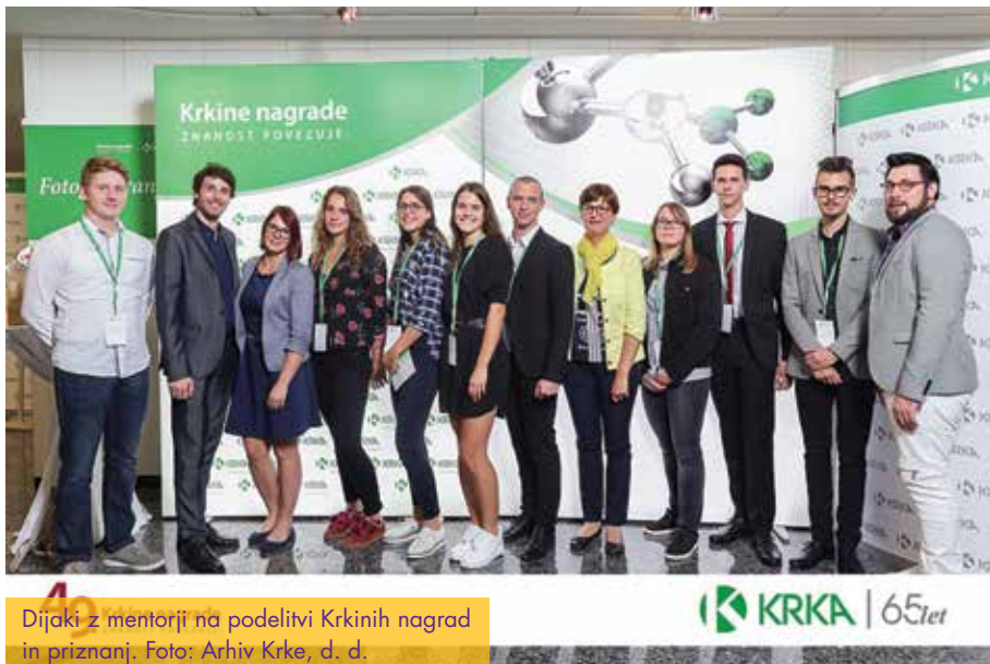
Dijaki z mentorji na podelitvi Krkinih nagrad in priznanj.