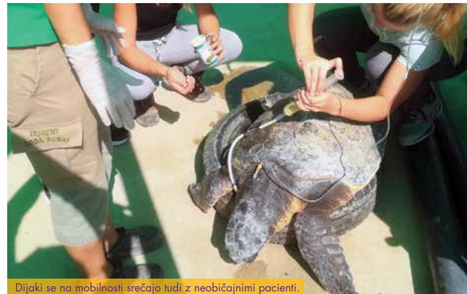
Dijaki se na mobilnosti srečajo tudi z neobičajnimi pacienti.

Pri izvajanju programa veterinarski tehnik skrbimo tudi za mobilnost naših dijakov in za pridobivanje praktičnih znanj v tujini. Šola je vključena v evropsko združenje šol za veterinarske tehnike Vetnet ter program Erasmus+, zato naši dijaki skupaj z mentorji veterinarji opravljajo praktični pouk na Cipru, Irskem, Češkem, Švedskem, Finskem, v Španiji, Bosni in Hercegovini ter na Kosovu.