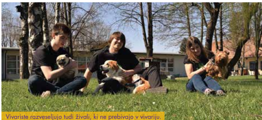
Vivariste razveseljujejo tudi živali, ki ne prebivajo v vivariju.