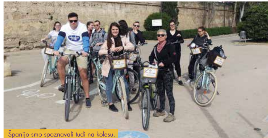
Španijo smo spoznavali tudi na kolesu.

Projekt mobilnosti za dijake tehniške gimnazije je začel teči decembra 2015. Dijaki nova znanja pridobivajo v laboratorijih in izobraževalnih ustanovah, ki izvajajo programe, podobne našim. Strokovno se izpopolnjujejo v Španiji, na Finskem, Portugalskem in Poljskem. Ob strokovnem delu spoznavajo tudi naravno in kulturno dediščino dežel, ki jih obiščejo.