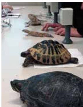
Prebivalke vivarija se rade postavijo na ogled.