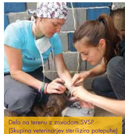
Delo na terenu z zavodom SVSP (Skupina veterinarjev sterilizira potepuhe)