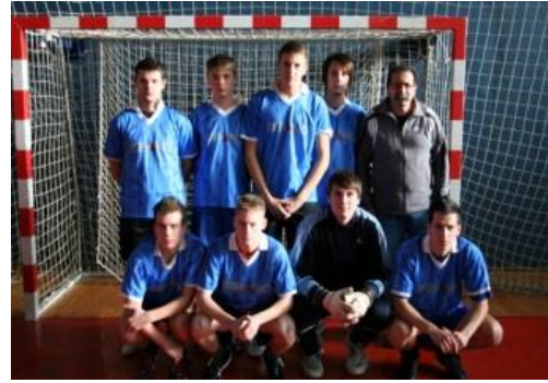
Gare e incontri sportivi

Ogni anno i nostri alunni partecipano alle gare di lingua italiana, gare di economia, gare »Zvezda« di gestione economica e gare di ragioneria.