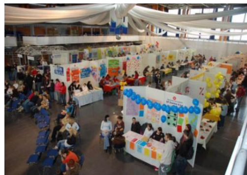
Fiera delle simulimprese a Celje