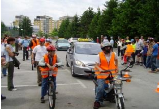
Gare di guida sicura

La scuola organizza e partecipa a tanti progetti sia nazionali che internazionali.