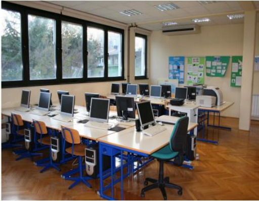
Aula di tecnologia