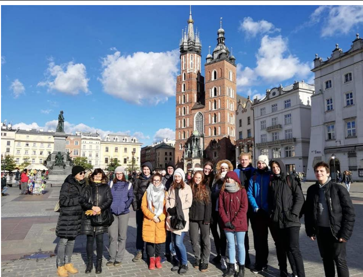
Erasmus+ obisk dijakov na Poljskem.